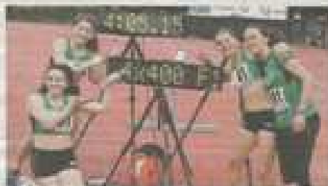
Le quattro staffette dell'Atletica Impresa Po vincitrici della staffetta.